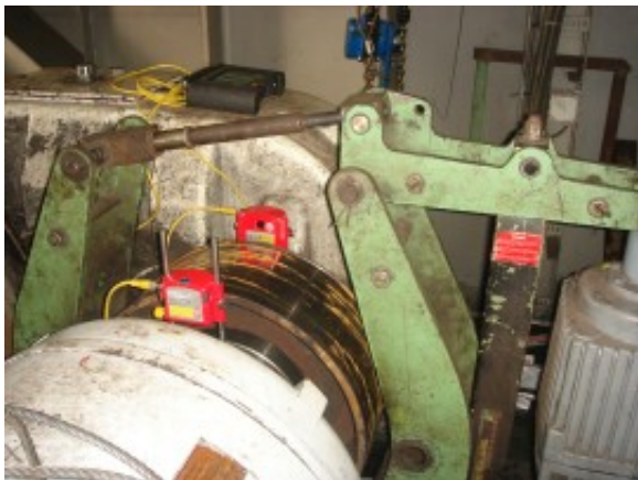
Hier wordt de elektromotor op de tandwielkast uitgelijnd