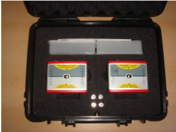
Het nieuwe PAT Uitlijnsysteem voor V-Snaren.